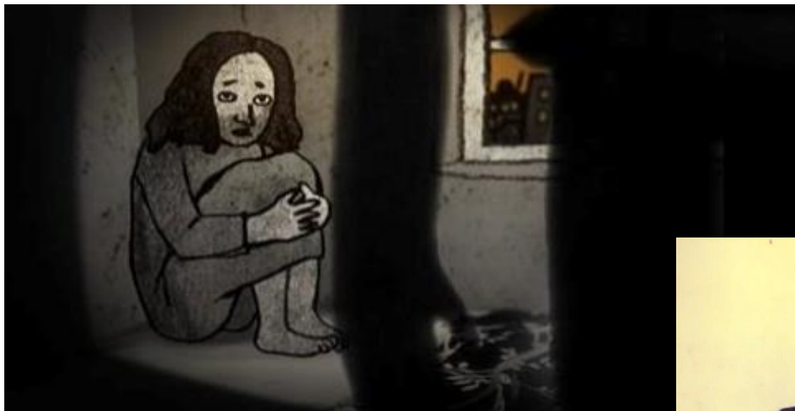
Brennpunkt: Fortell og forsvinn