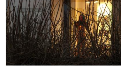
I dag får bare trafficking-ofre som vitner i retten beskyttelse i Norge. Men de fleste sakene henlegges av politiet.

I dag blir mange av ofrene for menneskehandel sendt ut av Norge selv om de har anmeldt bakkennene sine til politiet. Nå har en enstemmig justiskomite gått inn for at de skal få bedre beskyttelse.