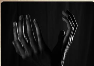
Negativ sosial kontroll

Samarbeid mot negativ sosial kontroll, tvangsekteskap og kjønnslemlestelse