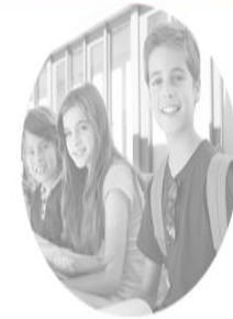
5.-7. trinn Åpner høsten 2018