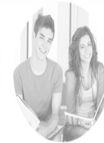
VGS Åpner høsten 2018