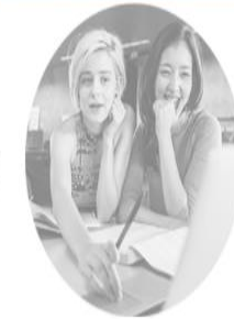
8.-10. trinn Åpner høsten 2018