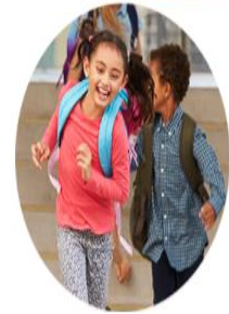
1.-4. trinn BUFDIR